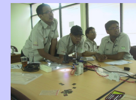
Pelaksanaan Training In-House