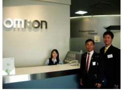
Authorized Distributor Omron

PT. Karunia Prima Engineering adalah perusahaan yang bergerak di bidang otomasi industri dan merupakan Distributor resmi untuk produk Omron.